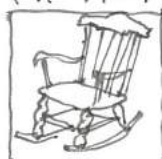
ボストンローチェア