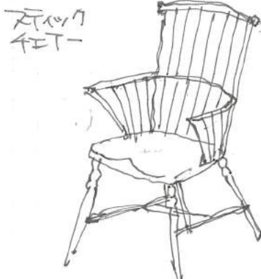
コーンバック 1750年代